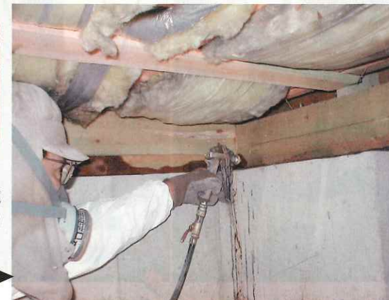
床下での月桃成分の散布