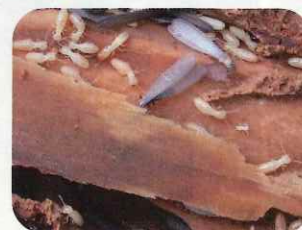
森林の中で枯れた木を分解する役目を持つヤマトシロアリ