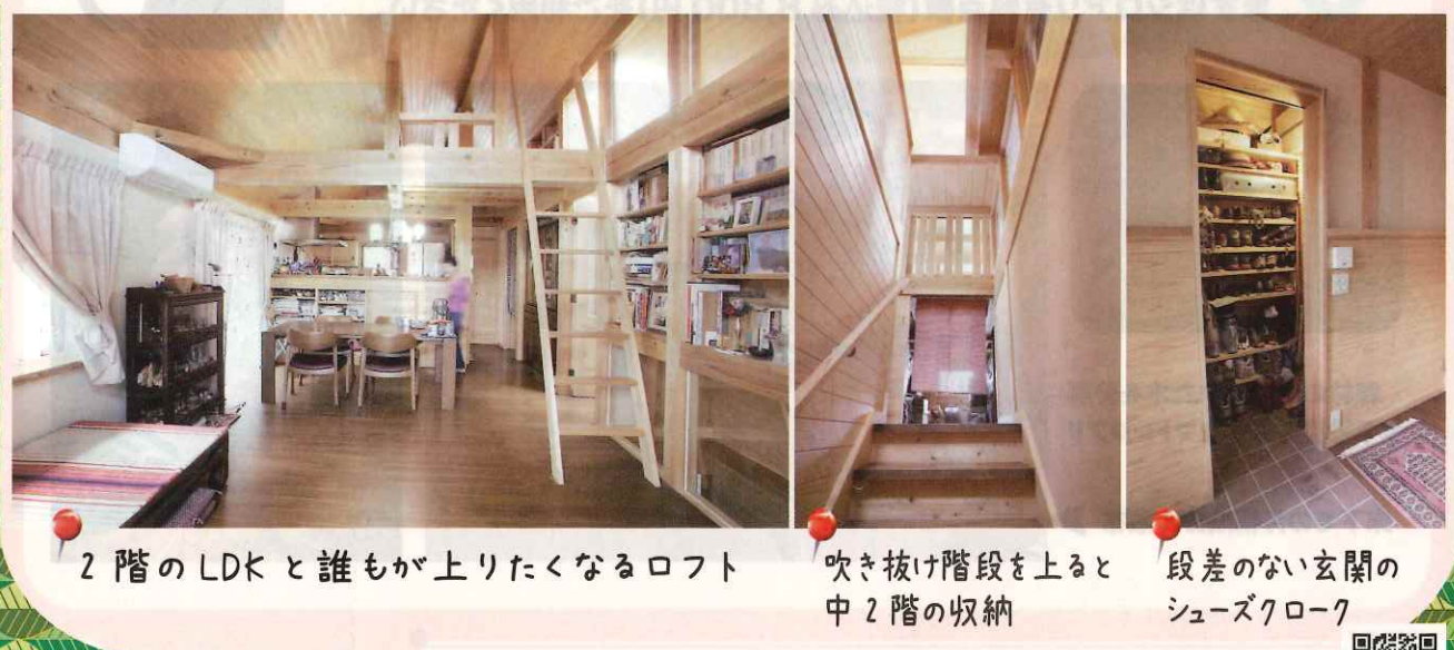
2 階の LDK と誰もが上りたくなるロフト 吹き抜け階段を上ると中 2 階の収納 段差のない玄関のシューズクローク