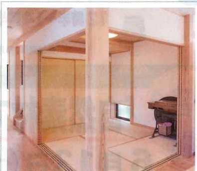
普段は引き戸が開いていて、客人が泊まるときには個室となる畳の部屋