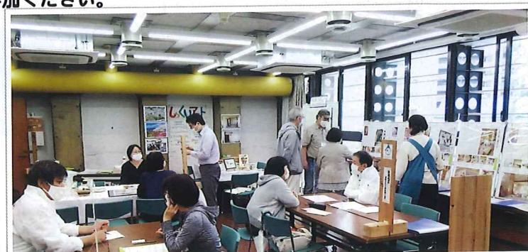
相談コーナーの様子