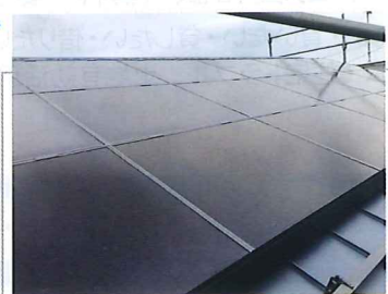
CIS(銅・セレン・インジウム)系太陽光発電(厚木市Y邸)

太陽光発電の価格は、10年前に比べてかなり下がってきました。例えば、4.18kWの太陽光発電設置で税込み130万円。費用回収は14年くらい。毎年、2トン以上のCO2を削減できます。