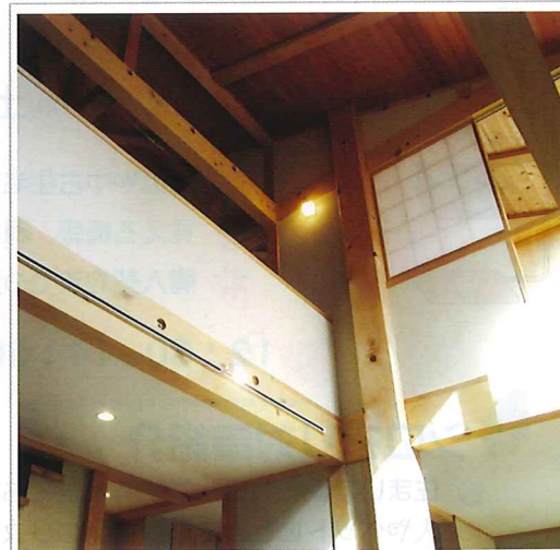
2階からも眺めを楽しめる広々とした吹き抜け空間

2018年春にオープンしたモデルハウス「希の家」(山田建設)は、断熱性能が神奈川県基準の1.85倍で北海道レベル、夏の暑い日射を室内に取り込まない日射遮蔽率は1.75倍。夏用エアコン1台と冬用エアコン1台で冷暖房が足りてしまいます。省令準耐火仕様で火災保険料が半額、耐震等級3で地震保険料も55%。広々とした吹き抜け、隠れ家のようなちゃぶ台付き4畳の和室など、敷地を活かした設計で、毎回「この家をそのまま買いたい」との声がありました。