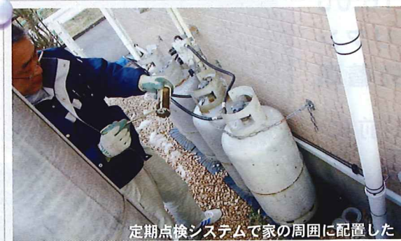
定期点検システムで家の周囲に配置した シロアリ生態監視ステーションをチェック

オルタスクエアのシロアリ防除の基本は、予防のために殺虫剤を撒くのではなく、年に1回、専門家が げっとう 床下と家の周囲をチェックする「定期点検システム」です。点検でシロアリがいた場合は、沖縄の植物「月桃」を使用して駆除します。床下のシロアリ被害について不安がある方は、まずは「有料床下診断」(税込み8,800円)をご利用ください。写真と調査書で床下の状況をご報告します。