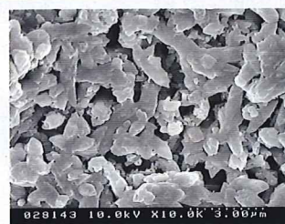
漆喰表面の顕微鏡写真

その主成分は、純度の高い石灰岩を塩と混ぜて特別な窯で3日間かけて製造する結晶石灰です。この漆喰を壁に塗った状態を顕微鏡で撮影したのが右の写真です。漆喰の結晶の大きさは約5~10マイクロメートル(0.005~0.01 ミリメートル)。結びついた結晶の間には隙間がたくさんあります。