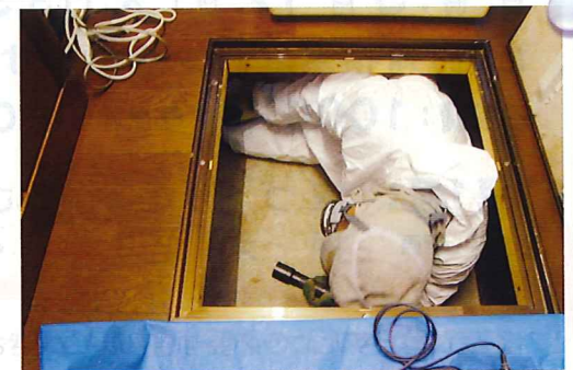
床下のシロアリのチェックだけでなく湿度も測定