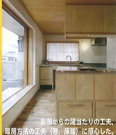
南側からの陽当たりの工夫、暖房方法の工夫(窓、床暖)に感心した。

冷暖房設備も色々あることがわかりました。すごくシンプルな印象でしたがキッチンがよかったです。