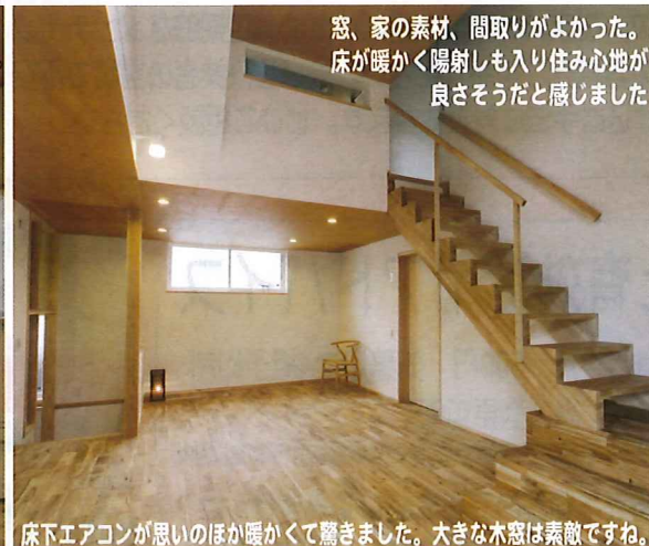
床下エアコンが思いのほか暖かくて驚きました。大きな木窓は素敵ですね。

窓、家の素材、間取りがよかった。床が暖かく陽射しも入り住み心地が良さそうだと感じました