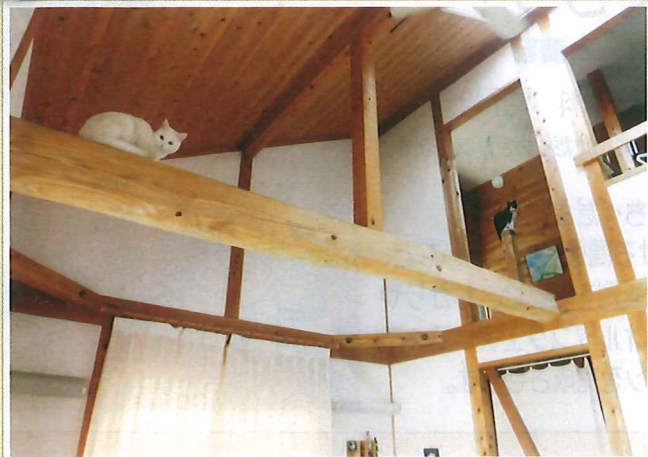
広々した吹き抜けリビングでつらぐ、シロちゃんとクロくん

敷地面積: 119.05㎡ (1・2階 延床面積: 92.53㎡ 地階: 25.21㎡ 車庫20.51㎡) 屋根: 不燃認定カラーベスト 外壁: ガルバリウム鋼板 床: 無垢板張り 壁: 漆喰塗り 設備: 温水式床暖房