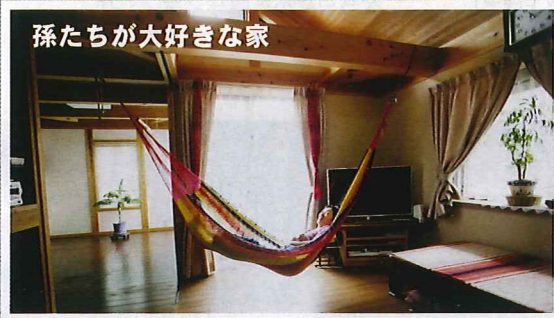
孫たちが大好きな家

● 段差がなくフラットな玄関、自然塗装を施した無垢の木の床、心が安らぐ風合いの珪藻土壁と、お洒落な雰囲気のY邸。2階のリビングには三角屋根の高いロフトがあり、登山仲間から「都会の山小屋だね」と賞賛されました。オルタスクエアの北海道産珪藻土は、調湿性能が高いだけでなく、成分が全て天然素材でできた本物です。様々な設計の工夫とともに、ぜひ室内空気質を感じてください。