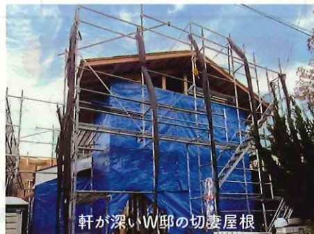
軒が深いW邸の切妻屋根

敷地面積: 159.16㎡(48.15坪) 延床面積: 89.23㎡(27坪) 屋根: スレート葺き、外壁: 防火サイディング 床: 無垢板張り 壁: 漆喰、紙貼り 天井: 無垢板張り 設備: 温水床暖房 性能: 耐震等級3、省エネ等級4