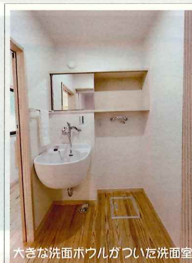
大きな洗面ボウルがついた洗面室