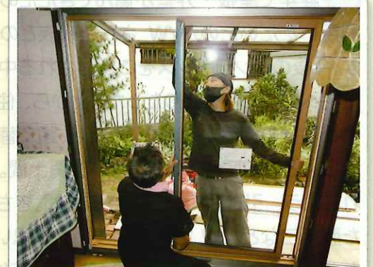
トリプルガラスサッシのカバー工法工事