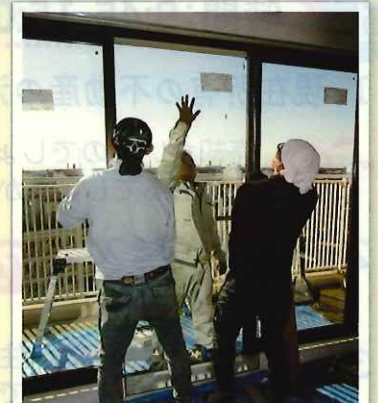
真空ガラスへの交換工事

補助金 14,000円 × 5枚 + 10,000円 × 5枚 = 120,000円