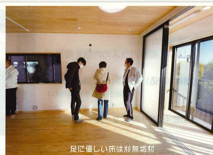
足に優しい床は杉無垢材

オルタスクエア(株) ☎ 045(476)1105 (日祝を除く9時~17時) お問い合わせ専用QRコード→