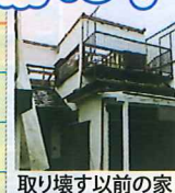
取り壊す以前の家

娘さん、息子さんはまだ小学生でした。その後、約10年暮されて、建て替えを決意。冬、あまりにも家の中が寒かったからです。