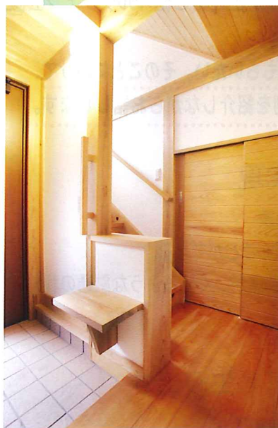
A邸は工事中の為、同様の「木と漆喰の家」 港南区 T 邸の写真を使わせて頂きました

Aさんご家族は、今までの家に20数年住んでいましたが、色々 と直したいところが出てきて、当初は大型リフォームをご検討。 しかし、可能なリフォームの内容や金額を検討しながら、当社 の新築見学会にも参加するうちに、「木と漆喰の家」に建て替え たいという夢がふくらみ、新築のご相談となりました。