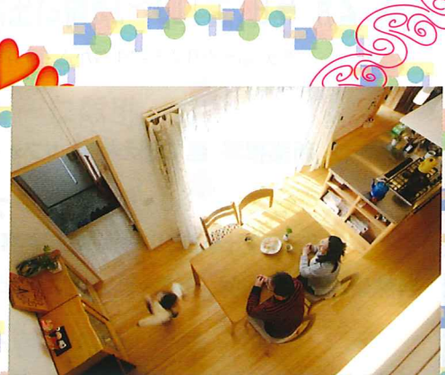
南区 W 邸