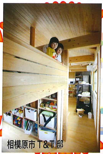
相模原市 T&T 邸

2023年度に向けて、国レベルでも、「エネルギー価格高騰の影響を受けやすい子育て世帯・若者夫婦世帯」が、高い省エネ性能の住宅を取得する際に補助金支援していくことが決まっています。 オルタスクエアの住宅は国産木材を多く使い、炭素貯留の役割を果たしているため、断熱等級 5 と組み合わせれば、100万円の補助金をうけることができます。