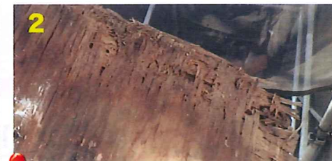
2 防水シートをはがすと下地板がかなり傷んでいました