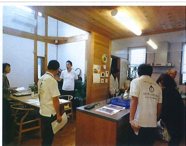
2016年秋に開催したH邸の築7年見学会

漆喰塗のすがすがしい吹き抜けや、富士山を眺めながら入ることのできるお風呂なども備えた住宅です。