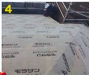
4 全体に防水シート貼り