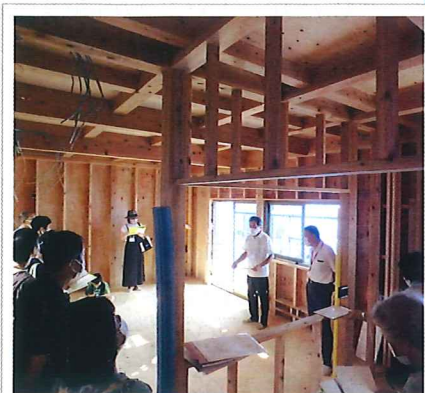
2020年9月 T&T 邸構造見学会