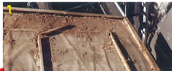
1 瓦をはがすと、雨漏りが発生している場がよくわかります。ここは北西の角です

工事に入り、瓦を取り除くと、下地板が傷んでいる場所が 3 か所ありました。いずれも傷んでいる部分を切り取り、新しい下地板を足しました。