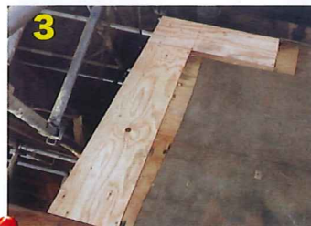
3 傷んだ部分を取り除き新しく下地板を貼りました