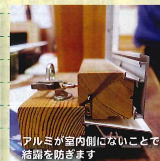
アルミが室内側がないことで結露を防ぎます