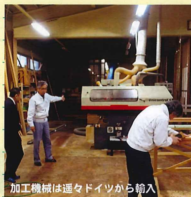
加工機械は運々ドイツから輸入

雨の多い日本で木製サッシの耐久性を高めるため、県内の大径木杉材の赤身や青森ヒバを使っていますが、ヒノキ材も開発していく予定です。木部を守るための塗料や塗装方法についても研究が進んでいました。現在は、輸送が不効率であったりして価格がまだかなり高いため、効率よい規格の工夫や流通の仕組みをつくっていく必要があります。