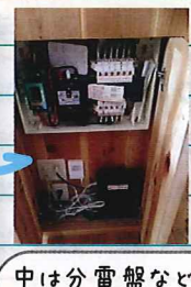
中は分電盤などが収納されました