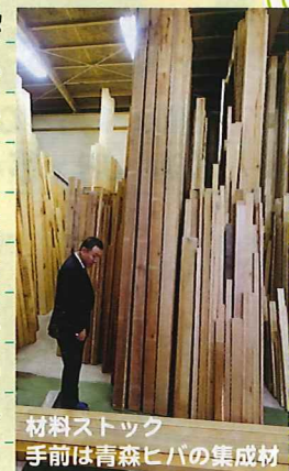
材料ストック 手前は青森ヒバの集成材

「アルス」では、ドイツで普及している「持ち上げ→スライド→降ろし」方式を採用しており、これは、通常の引き違いサッシの5倍の気密性能を持ちます。さらに最近、このドイツ方式以上の機密性能を持つ「エコスライド」方式を独自に開発しました。窓は壁の10倍以上も熱が伝わりやすく、住宅の断熱性を高める上での急所でしたが、ガラスを3枚にすれば外壁と同レベルの断熱性能も実現できます。