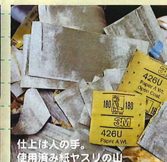
仕上は人の手。使用済み紙ヤスリの山

発行：オルタスクエア株式会社 協力：オルタサークル 電話：045(476)1105 FAX:045(476)1106