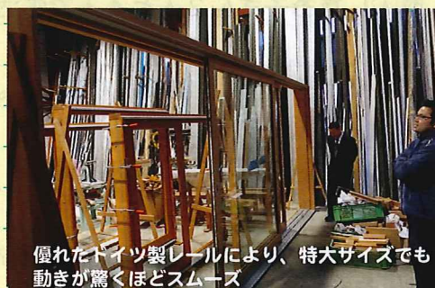
優れたドイツ製レールにより、特大サイズでも動きが驚くほどスムーズ

「庇（ひさし）を深くして、壁を雨から守りつつ、夏の暑い日差しを遮る」という、日本古来の知恵ある「家づくり」の考えに、木製サッシはとてもなじむと思いました。