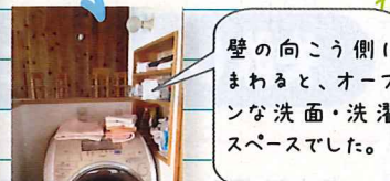
壁の向こう側にまわると、オープンな洗面・洗濯スペースでした。