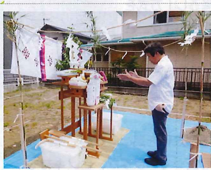
8/21 H邸 地鎮祭の様子

生まれたばかりの男の子がいる若いご夫婦のための住宅です。南北に長い旗ざお敷地ですが、東側に水路用暗渠(あんきよ)が埋まっており、ここの空間の開放性を積極的に設計に取り入れました。予算を抑えるため、建具や間仕切りを最小限とし、これから家族が増え、成長していくのに合わせて必要なものを足していきます。吹き抜けも将来は床を張って部屋とする可能性を織り込みました。