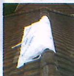
勝手に瓦が外され養生されていた

2015年の春にオルタスクエアに1本の電話がありました。隣家の工事業者が瓦のずれが気になり無償でみてくれるというので、つい屋根にあげてしまったところ「瓦がずれていたんで養生したが、すぐ工事をしないと雨漏れする」と見積書を提案されて工事を迫られ、業者ベースに話がどんどん進み、不安になった組合員からの相談電話でした。