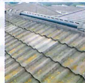
下の瓦は割れておらず、瓦を戻して作業完了

早速、オルタスクエアの屋根担当がその組合員宅の屋根に上り確認すると、屋根に全く問題はなく、瓦がずれていたと変に養生された部分に瓦を戻し完了。余計な工事をせずすみしました。今回ケースに限らず、同様に多くの方が飛び込み訪問セールスで言葉巧みに「今工事しないと大変ですよ」などと言われ本来必要ない工事をさせられる事があるのが現状です。