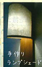
手作りランプシェード

発行:オルタスクエア株式会社 協力:オルタサークル 電話:045(476)1105 FAX:045(476)1106