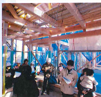
以前の構造見学会の様子

普段の新築見学会では上材や設備などに目を奪われがちですが、構造見学会では完成した見学会では見ることができない(完成したら隠れてしまう部分です)、床下の基礎の様子や土台、柱、梁の配置、太さ、金物が組まれている状況などを確認することができます。オルタスクエアの建物の耐震性能について知りたい方は是非、この機会を逃さずに見ていただきたいと思ひます。