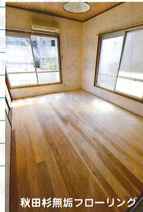
秋田杉無垢フローリング