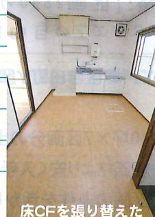
床CFを張り替えたキッチン