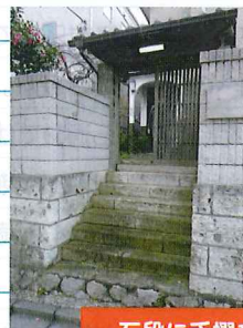
石段に手摺を設置