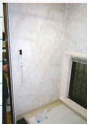
浴室に手摺を設置

行政に必要な書類を提出して承認されると、工事の実施になります。 横浜市や川崎市であれば、工事後にご本人から1割の費用をご入金いただければ、残りの9割の費用が保険から支払われます。